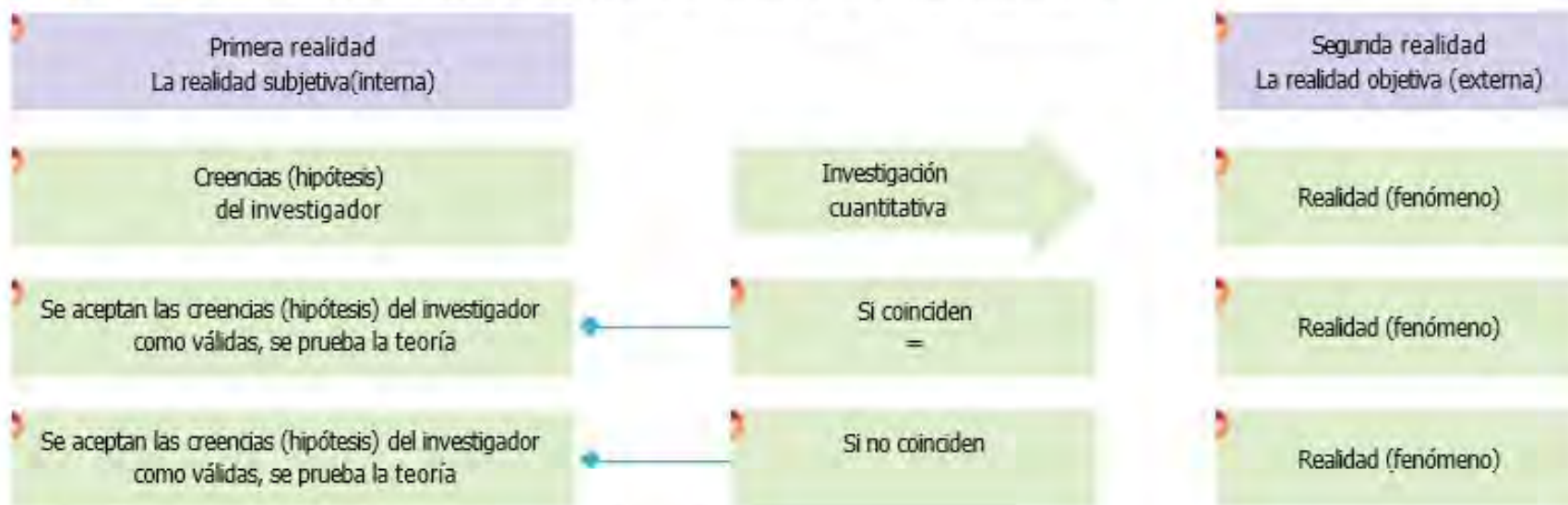
Figura 1.2 Relación entre la teoría, la investigación y la realidad en el enfoque cuantitativo.