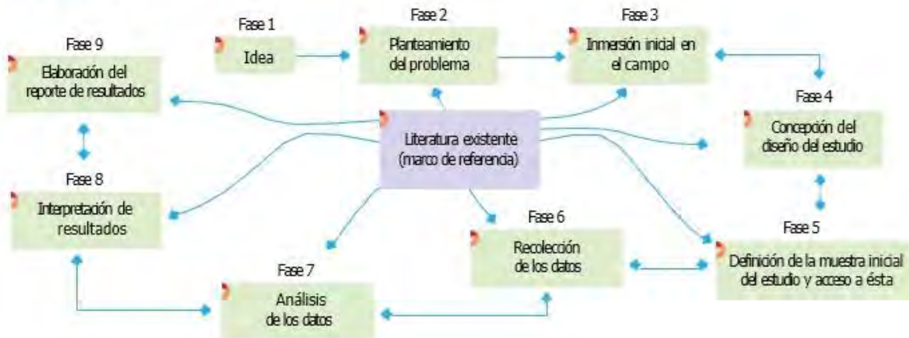
Figura 1.3 Proceso cualitativo.

Enfoque cualitativo Utiliza la recolección y análisis de los datos para afinar las preguntas de investigación o revelar nuevas interrogantes en el proceso de interpretación.