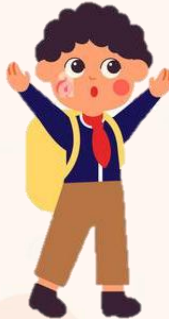
Etapa operaciones concreta 7 a 11 años