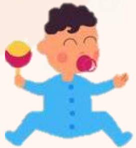
Etapa sensorio motriz 0 a 2 años