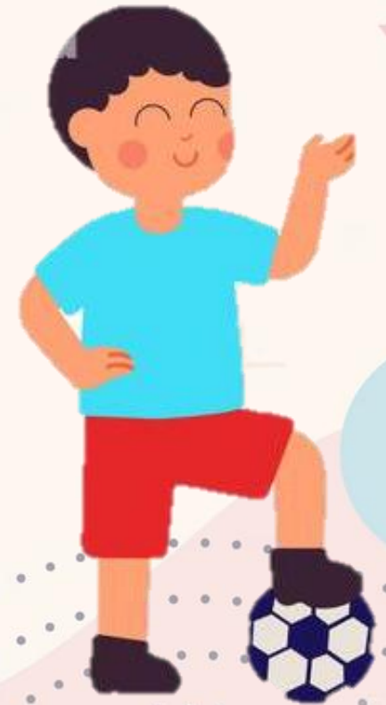
Etapa operaciones formales 11 años a la adultez