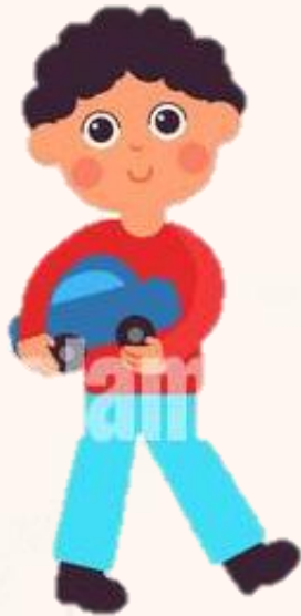
Etapa preoperacional 2 a 7 años